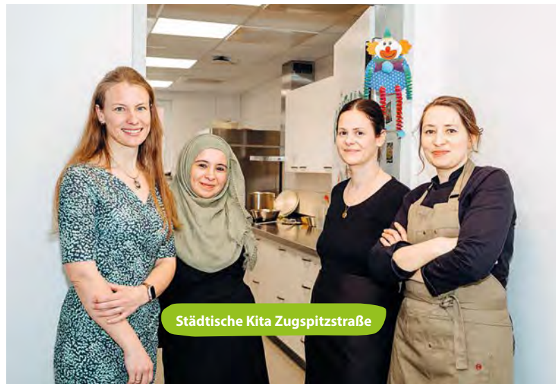
Städtische Kita Zugspitzstraße