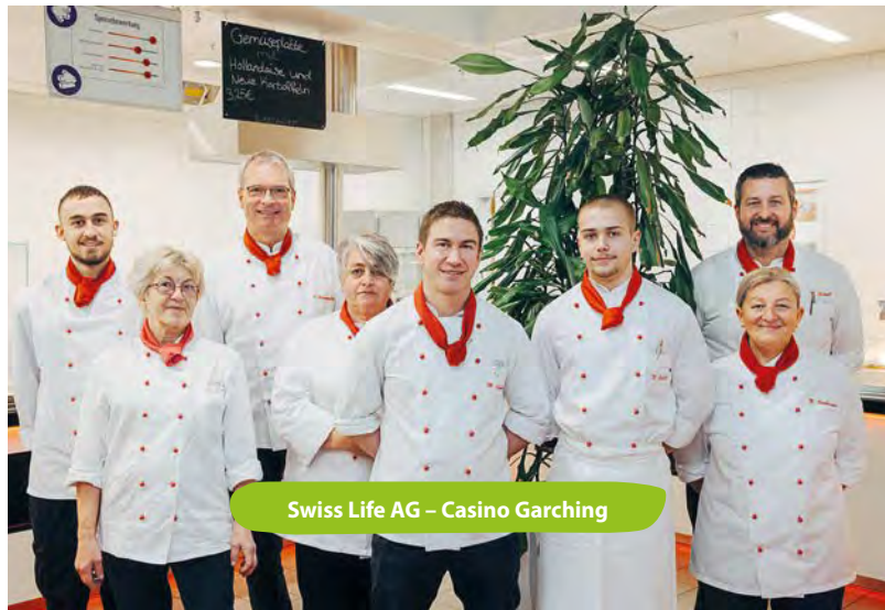
Swiss Life AG – Casino Garching