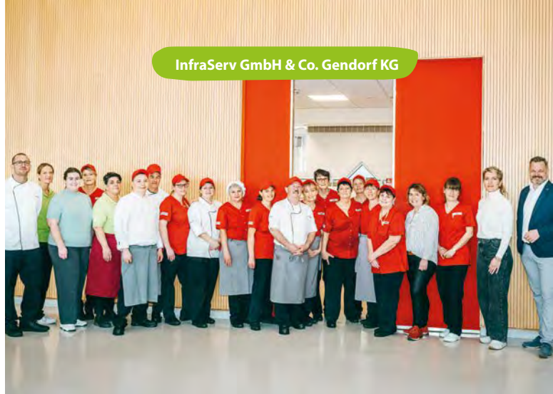
InfraServ GmbH & Co. Gendorf KG