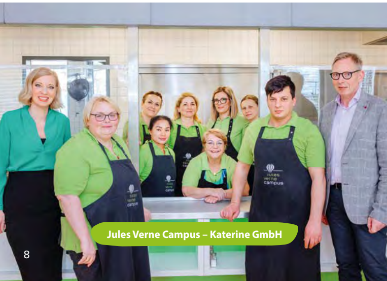
Jules Verne Campus – Katerine GmbH