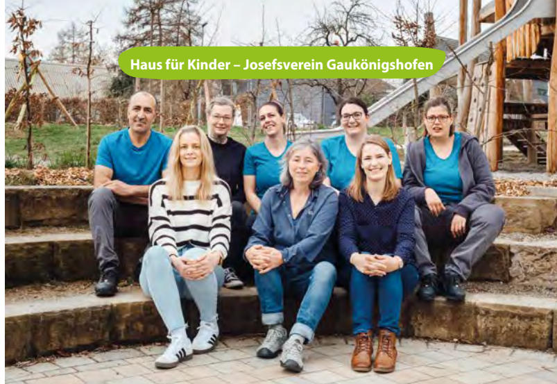
Haus für Kinder – Josefsverein Gaukönigshofen